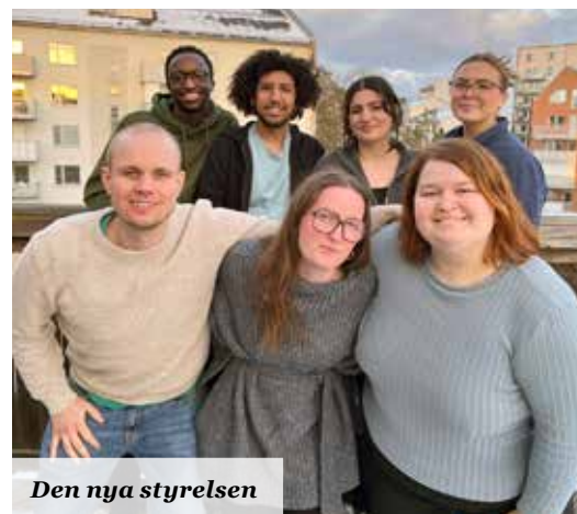
Den nya styrelsen