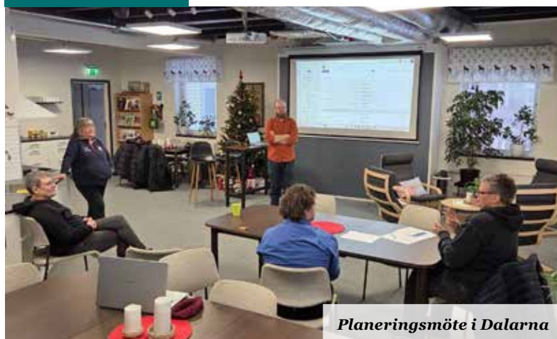
Planeringsmöte i Dalarna