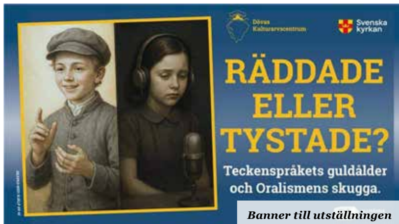
Banner till utställningen