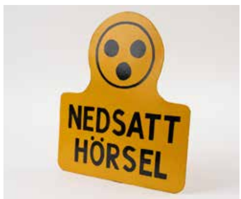
Ett av föremålen i vårt DigiMuseum.