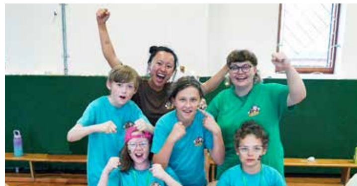
Svenska deltagarna på Eudy:s läger. Läs mer på nästa sida.

I år återvände SDUF till Almedalen efter några års uppehåll, vilket var mycket givande! Vi knöt värdefulla kontakter med beslutsfattare och partnerorganisationer och planerar nu