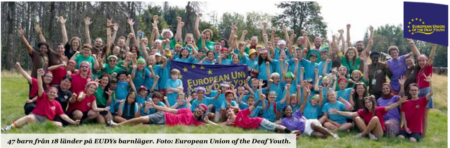
47 barn från 18 länder på EUDYs barnläger.

SDUF:s barnläger 2024 var en succé! Den 15-21 juli samlades barn och ledare på lägerplatsen i Järvsö, redo för en spännande vecka fylld med aktiviteter, umgänge och god mat. Veckan bjöd inte på mycket sol, men barnen var glada ändå. Lägre visade verkligen att det inte finns dåligt väder, bara dåliga kläder. Barnen badade och lekte oavsett väder, och ledarna deltog med leenden! Lägre avslutades med en tårttävling där lagen dekorerade tårter som ledarna dömde. Alla tårter var så goda att det var svårt att välja en vinnare. Sista kvällen hade vi fest med temat "Min hjälte" och tog avsked av varandra. Vi hade även det obligatoriska vattenkriget. Hoppas vi ses nästa år!