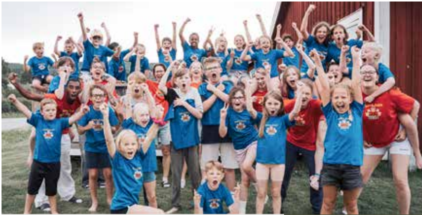
Juli i Järvsö: Glada barn, trots dåligt väder...