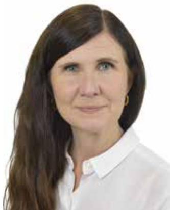
Riksdagsledamoten Märta Stenevi (MP) i SVT Nyhetstecken efter att ha sett föreställningen Audism genom livet.