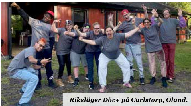
Riksläger Döv+ på Carlstorp, Öland.