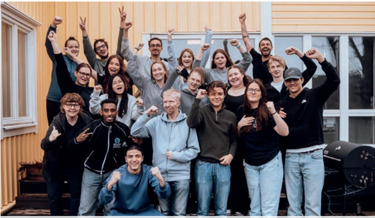
Det blev en lyckad ungdomsklubbkonferens på Björkö!