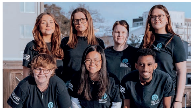
Sveriges Dövas Ungdomsförbunds styrelse 2023-2024.

Det kändes så roligt att bli vald som ledamot i SDUF, men när jag insåg den starka mångfalden inom styrelsen, så känns det ännu mer speciellt. Då pratade vi om att vårt motto för året skulle vara 'representation matters' (det betyder 'representation är viktigt' på engelska) och det har fått mig att reflektera.