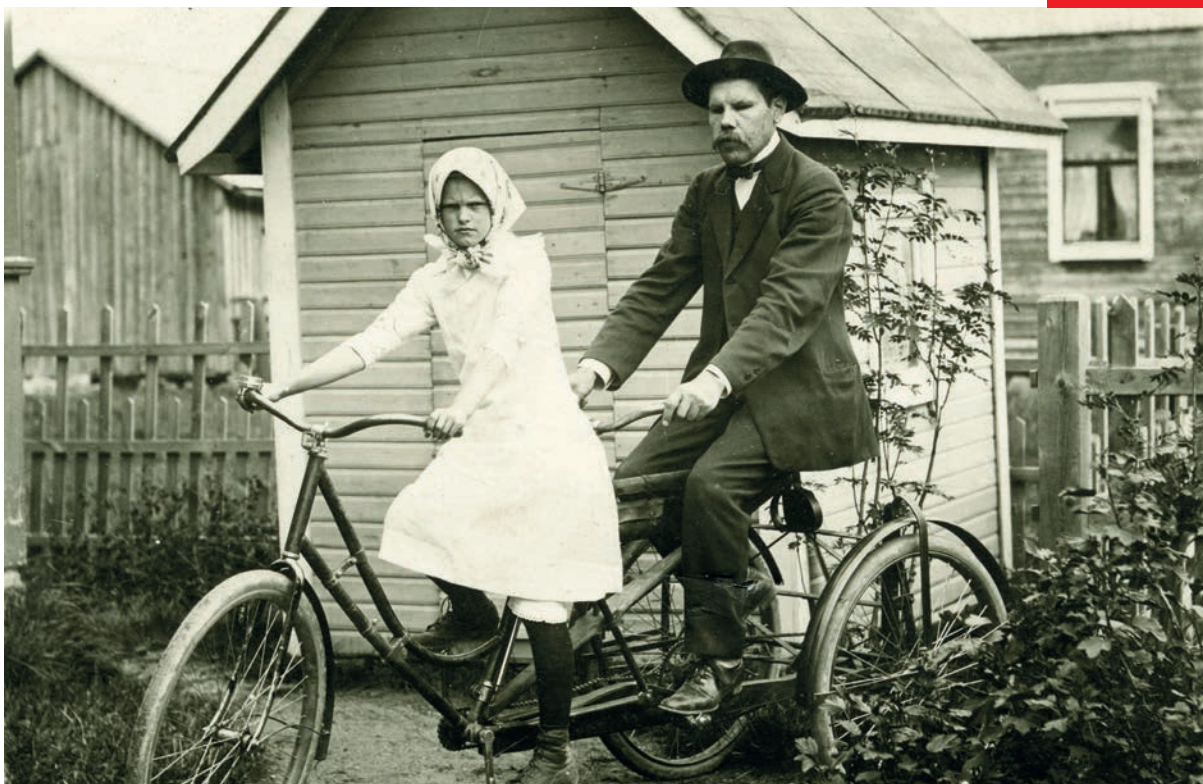
Tandemcykeln på bilden är bland de saker som Frans byggt själv.