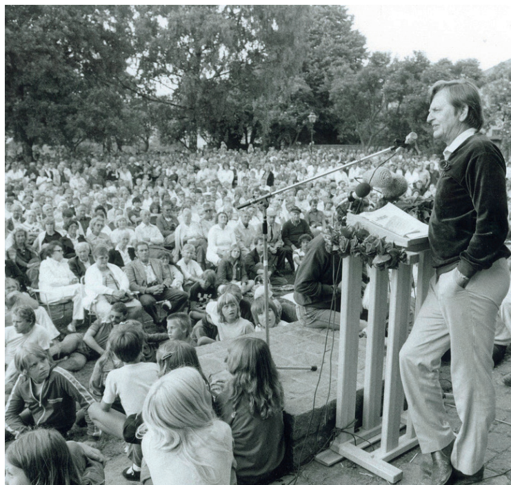
Olof Palme i Almedalen 1982.

För 15 år sedan deltog SDR för första gången i Almedalsveckan på Gotland. Här ger vi en liten resumé över vad Almedalsveckan är och beskriver vad SDR brukar göra där samt vilka frågor vi lyfter.