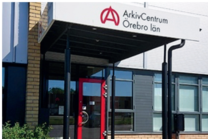
Projektet Dövas kulturarscentrum har haft ett givande besök på ArkivCentrum Örebro Län.

Under våren har DigiDöv arrangerat workshops med varierat deltagarantal och två workshops blev inställda. Vi har insett att workshoppen är för lång med tre timmar och kommer därför att ändra upplägget. Kommande workshops kommer att bli kortare och med ett annat innehåll samt genomföras med ett begränsat antal deltagare. Det blir mer interaktivt med frågor och möjlighet att prova på olika appar. Tidigare föredrag från vårens workshops kommer att filmas och läggas upp på webbplatsen. Då finns det möjlighet för er som missat workshoppen att ta del av dessa. DigiDöv-guider i Stockholm har fått en introduktion och är redo att hålla småkurser. Våra DigiDöv-guider på övriga orter ska också få introduktion.