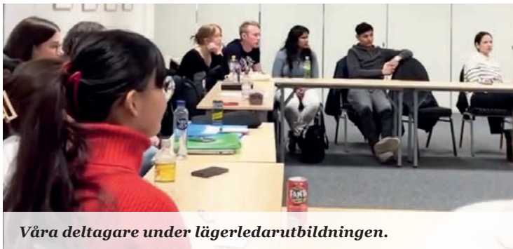
Våra deltagare under lägerledarutbildningen.