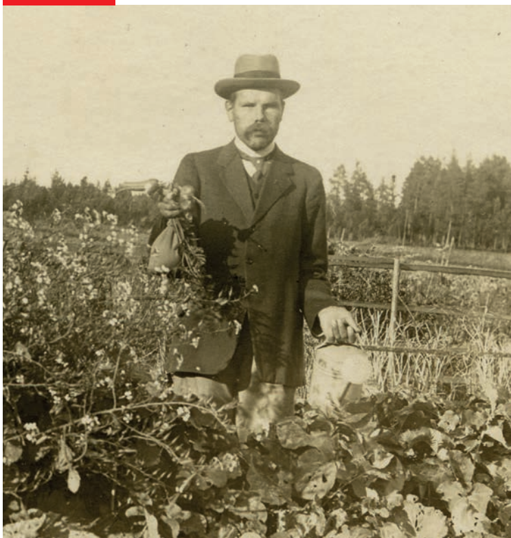
Frans i början av 1900-talet.