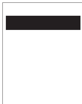
Toppbanner (datorläge) 980 (B) x 240 pixlar (H)