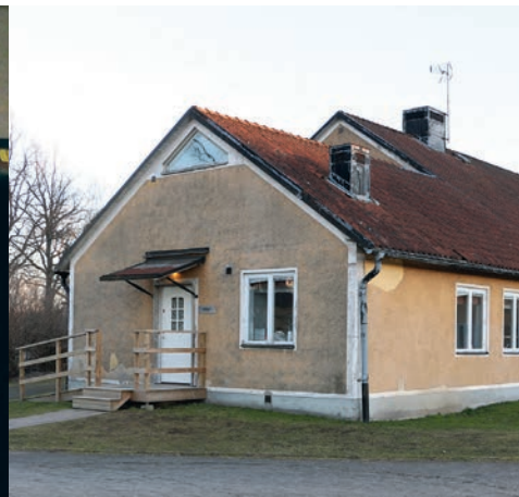
Lokalen Hörnet invid Vänerskolan.