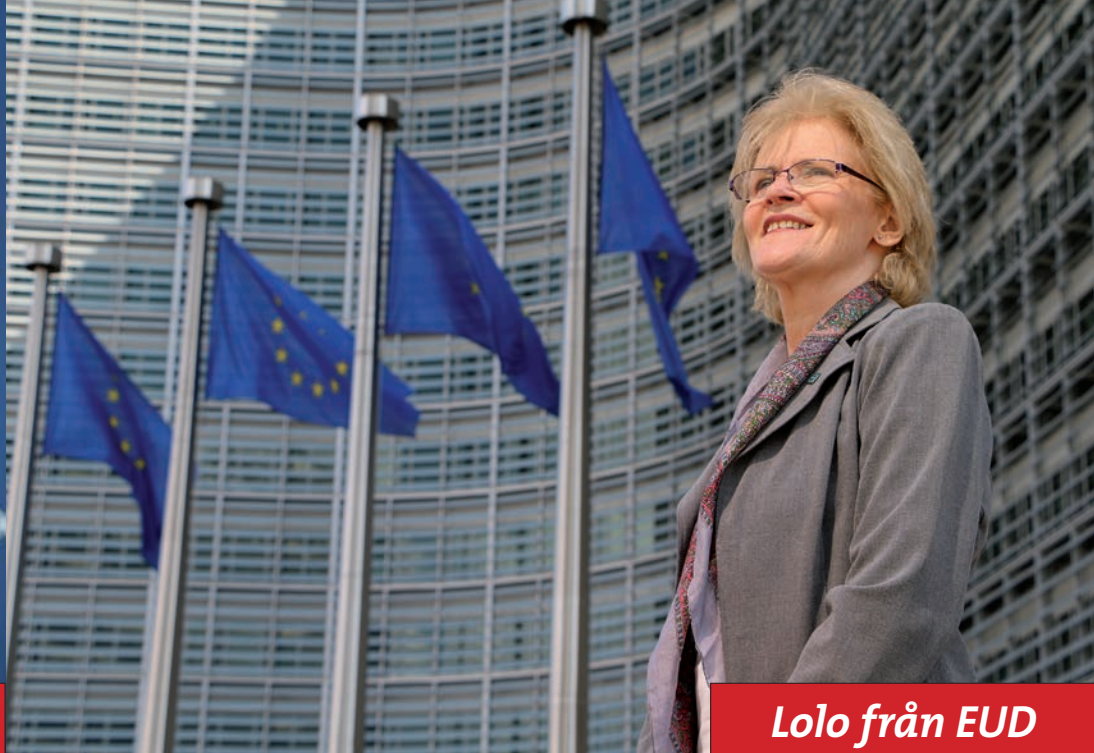
Lolo från EUD