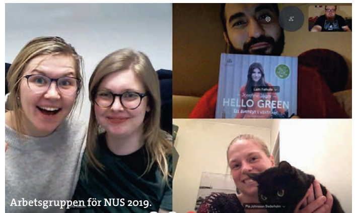
Arbetsgruppen för NUS 2019.

Vissa av besöken lyckades vi få ihop med våra systerorganisationer, DBU – Dövsblind Ungdom och UH – Unga Hörselskadade. Det är en perfekt kombination då många i vår målgrupp ofta vill delta i två eller fler organisationer och våra aktiviteter. Vi hade en gemensam lägerbroschyr som delades ut under alla besök och som också skickades ut till hörselvård och hörselenheter i hela Sverige, vilket var uppskattat och flera av dem frågade efter fler broschyrer. Vi ses igen kommande år!