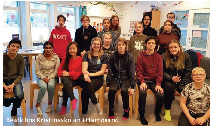
Besök hos Kristinaskolan i Härnösand.