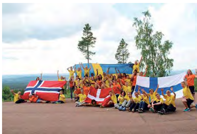
Nordiskt Juniorläger 2014

● Bilder och rapporter från sommarens läger kommer att finnas på vår hemsida inom kort, håll utkik!