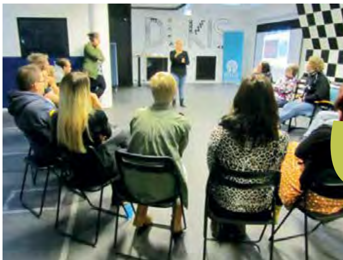
Från Ungdomsklubbskonferensen 2013 i Stockholm