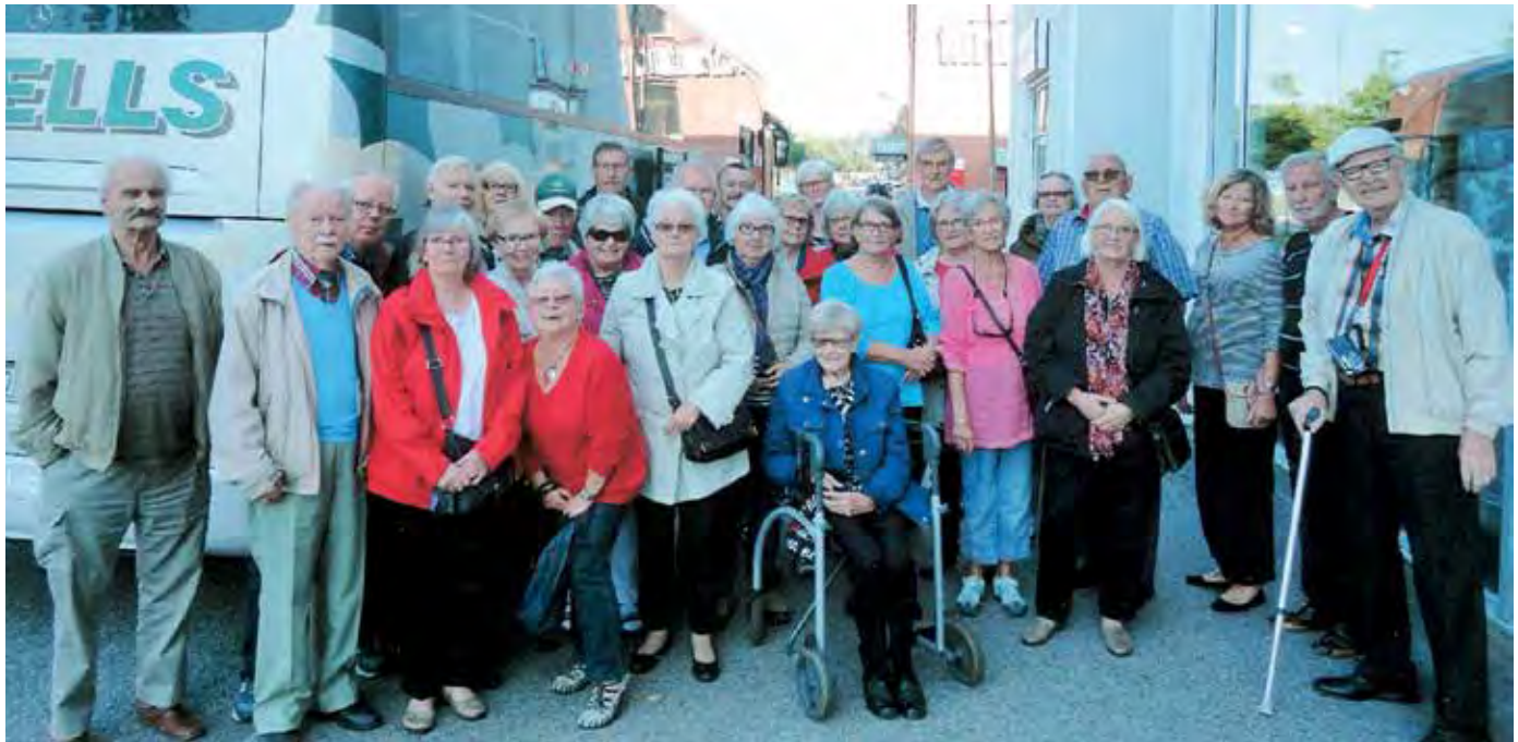
Skånes Dövas Pensionärsförening ordnade en bussresa till Borås.