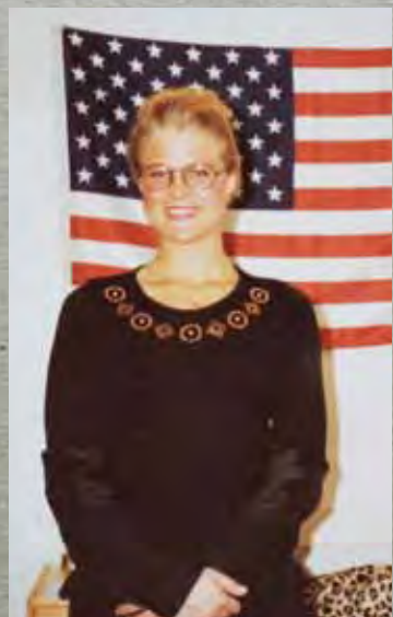
Hemma i lägenheten i Stockholm