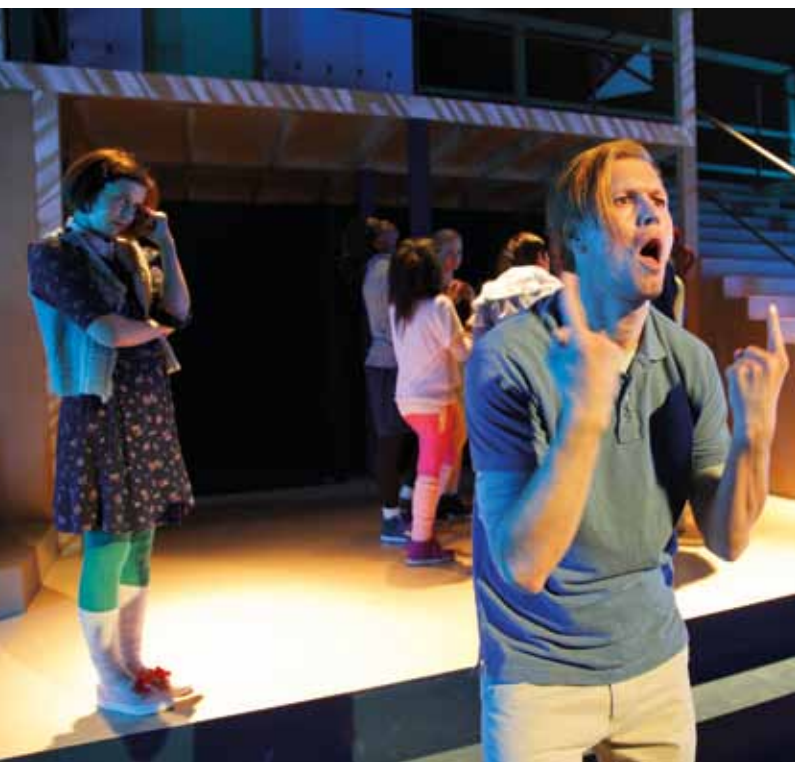
Visukalen Fame blev en fantastisk succé!