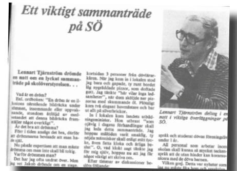
Ur SDR-Kontakt 1978.