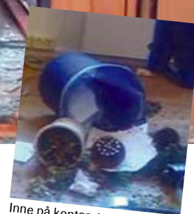
Inne på kontoret.