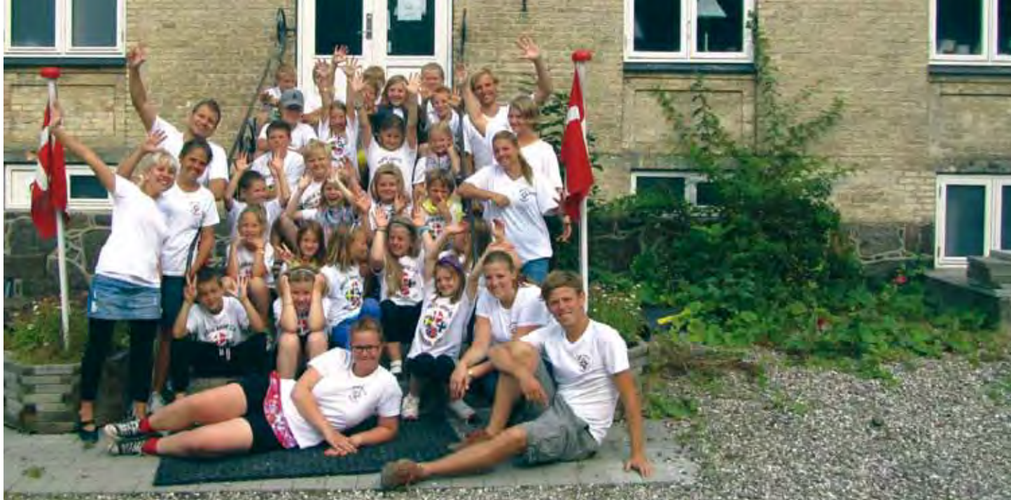
Deltagare och ledare på Nordiskt barnläger i danska Haslev.