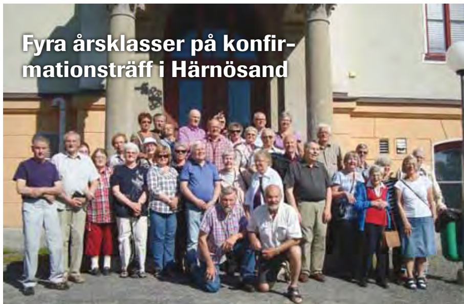
Hela gänget samlade framför skolan i Härnösand.

■ Fyra årsklasser som avslutade åttaårig skola och konfirmation 1949, -51, -53 samt -55 träffades för 3 dagars gemenskap 7-9 juni 2011. Härnösand bjöd på strålande väder när alla samlades på tisdagen.