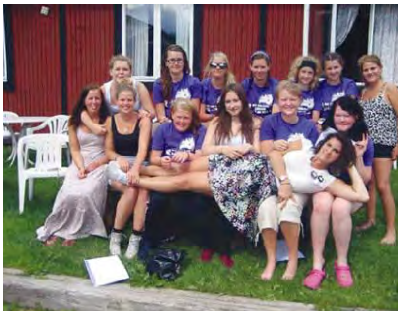
Deltagare och kursledare på årets ridläger i Leksand.