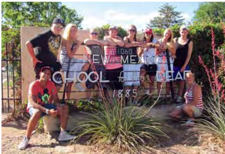
Nöjda deltagare på språkresan 2011.