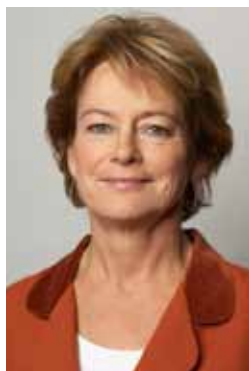
Lena Adelson Liljeroth.

... Lena Adelson Liljeroth, kulturminister, som i juni fick sitt cochleaimplantat (CI).