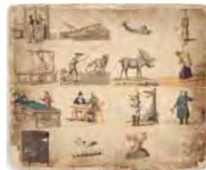
Undervisningstavla troligen från 1800-talet, från dövskolan i Borgå.

■ Eftersom det finska dövförbundet har ekonomiska problem, har de tvingats stänga Dövas museum i Helsingfors.