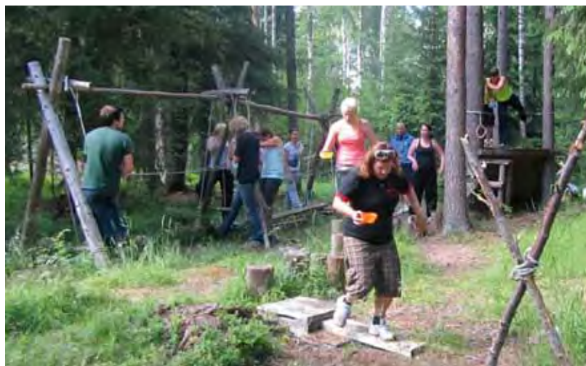
Full fart på NULison-deltagarna, en variant på tv-programmet Robinson.