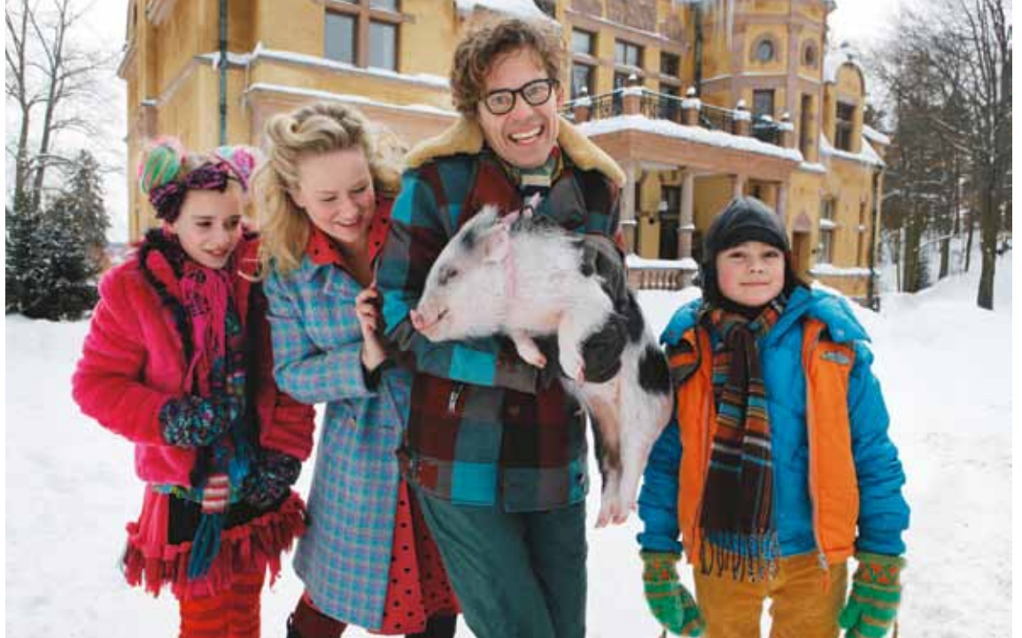
Familjen Rantanen i årets julkalender "Hotell Gyllene Knorren".

Landets tecken- språkiga barn får en tidig julklapp. SVT:s julkalender ska nämligen för första gången teck- enspråkstolkas. Vidare får vuxna tit- tare också en del av kakan: textad webb-TV på public service-jättens hemsida.