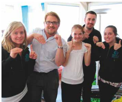
Ett gäng som varit med under en av Almedalsveckorna.