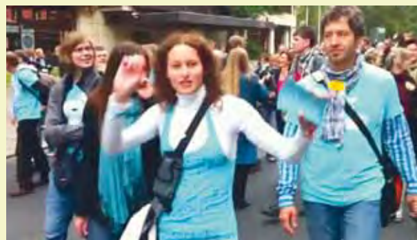
Deltagare i Turkos parad i Berlin.

Dövas Tidning har plockat fem pärlor från Youtube – alla med döv- eller teckenspråksanknytning. Skriv sökorden så kommer ni direkt till filmsnuttarna.