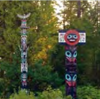
Totempålar längs vägkanten.