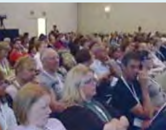
750 delegater deltog i kongressen.