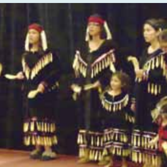
Uppvisning av lokal indianstam under välkomstceremonin.