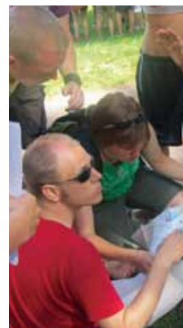
NUL race, variant av Amazing race.