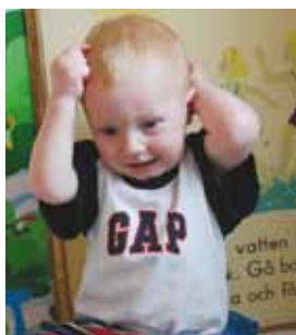
Med hjälp av babytecken kan barnet visa känslor.