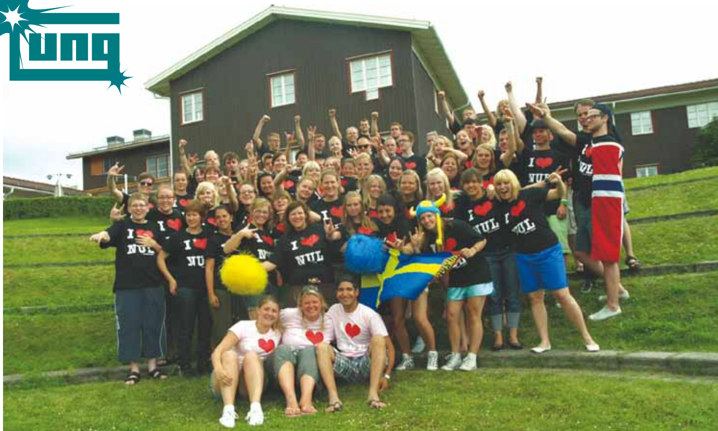
Tillsammans bidrog vi alla till en oförglömlig vecka med aktiviteter, föreläsning och lekdagar.