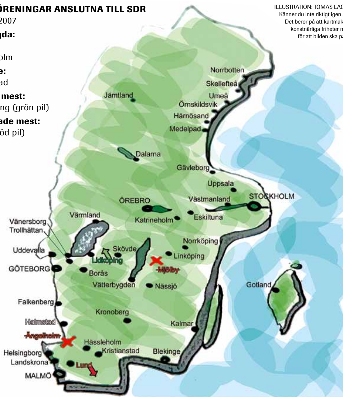
ILLUSTRATION: TOMAS LAGERGREN.

Känner du inte riktigt igen Sverige-kartan?