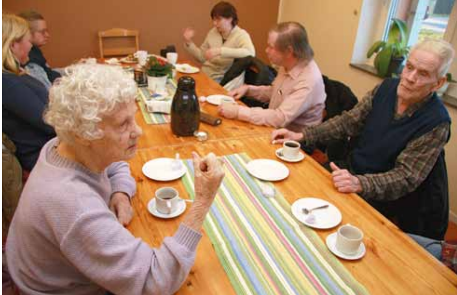
Dövföreningen har nu sina lokaler i Arbetarrörelsens hus en bit utanför Visby.

De unga stannar på fastlandet efter skolan