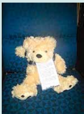
Nallen Truls med adresslapp runt halsen.