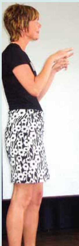
Tolken – en förutsättning för dövas delaktighet.