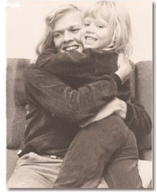
Lenas mamma förstod tidigt hur viktigt teckenspråket var för hennes utveckling.

• Intresset för dövföreningen och dövkulturen är inte som tidigare. Håller dövsamhället på att stagnera?