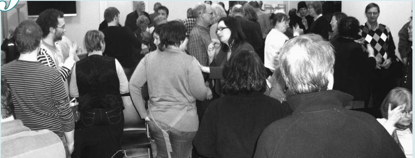
Det var ovanligt mycket folk på SDF:s föreningsmöte i februari – SDF-styrelsens förslag om extra kongress skapade intresse, men medlemmarna hade olika uppfattning i frågan.