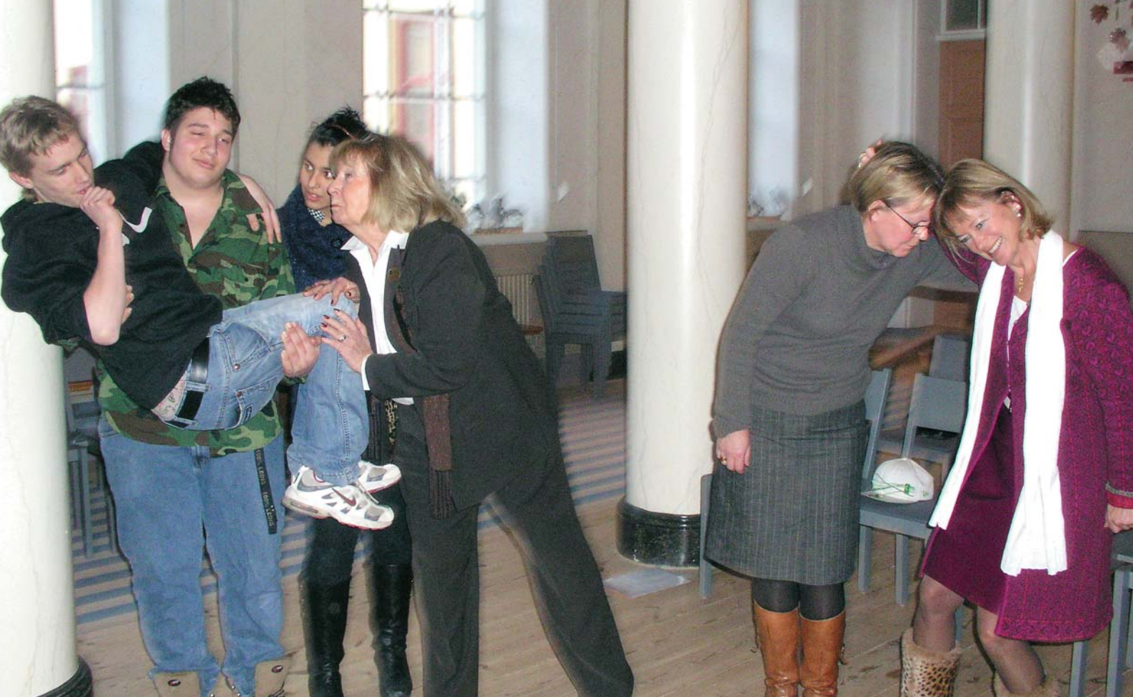
Stämningen var uppsluppen när kulturminister Lena Adelsohn Liljeroth (längst t.h.) besökte Manillaskolan.