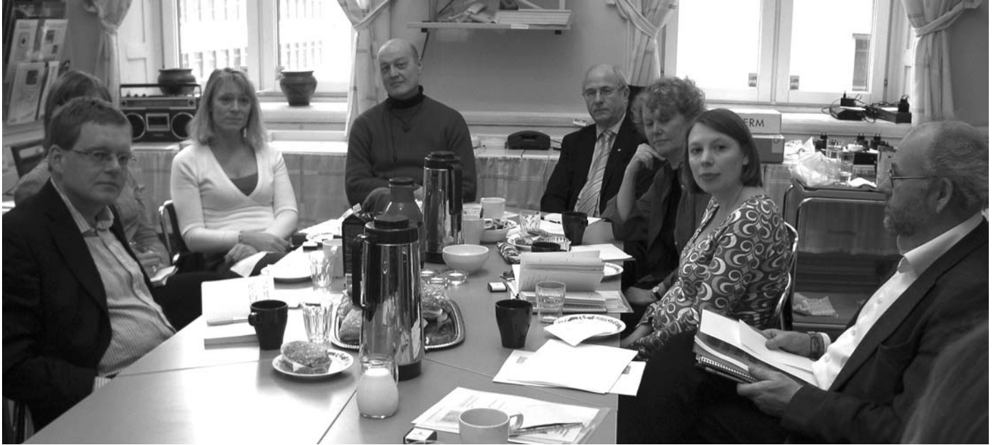
Tre teckenspråkstolkar vid Tolkcentralen i Stockholm bjöd in landstingsråd och landstingsledamöter för att presentera verksamheten.