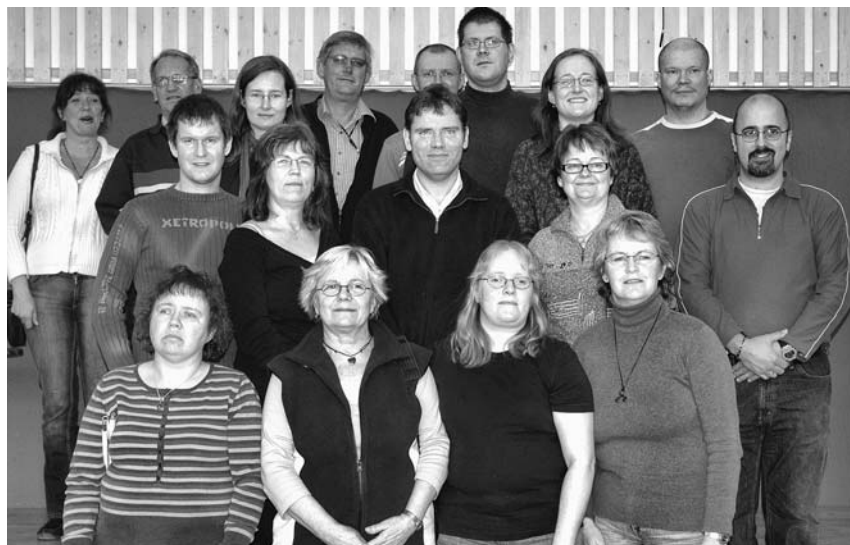
Kursdeltagare kom från hela landet.