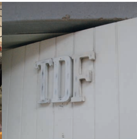
Dörr till föreningens lokal.