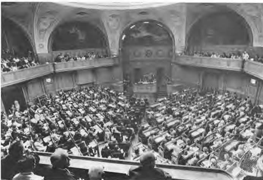
En helt fylld 2:a kammare. 362 personer fick plats och så många har det aldrig förr suttit i kammaren.

Det måste anses som ett beklagligt fel att inte skolöverstyrelsen vänder sig till de