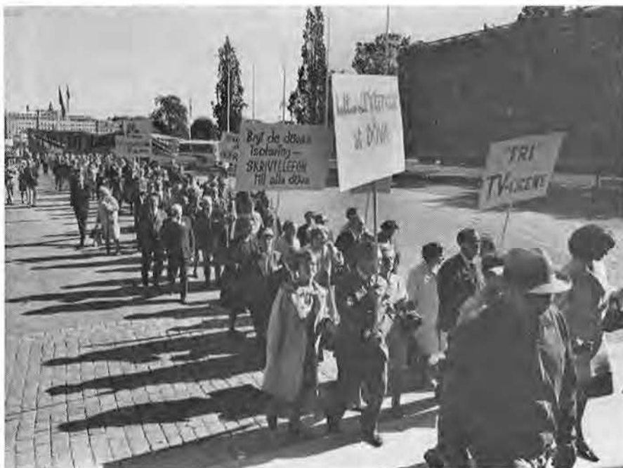
När första delen av demonstrationståget kommit in i riksdagshuset hade slutet inte börjat synas vid Operahuset.