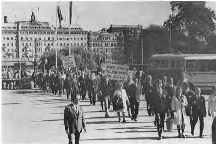
Här ses en del av det långa demonstrationståget ringla in vid riksdagshuset.

För de som inte fick vara med på Högloftet hade det ordnats med servering på Sofia ungdomsgård i centrum. Många föredrog dock att vandra i Stockholms city för att verkligen få insupa intrycken av huvudstaden inför den förestående hemfärden på söndagen. Vem vet när man kommer till Stockholm nästa gång?